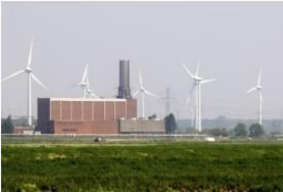
Abbildung 2 Druckluftspeicherkraftwerk Huntorf 9

Für adiabate Systeme: 2-3 % der Gesamtinvestition pro Jahr. Für diabate Systeme: Zusätzlich fallen Brennstoffkosten an, die im Bereich von 1,17 – 1,6 kWh CH 4 ,HU /kWh el,out liegen. Diese Werte entstammen den beiden einzigen existierenden kommerziellen Anlagen in Huntorf, Deutschland und McIntosh, USA 8