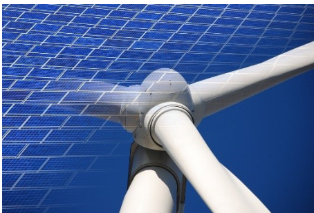
Bild 1: Energiespeichersysteme sind einer der Key-Enabler für erneuerbare Energien und gleichzeitig eine der facettenreichsten Technologien. Diesen widmet sich die Studie, um etablierte, aufstrebende und noch im Entwicklungsstadium befindliche Systeme und Technologien zu analysieren.

http://azl-aachen-gmbh.de/wp-content/uploads/2017/09/3_Pictures_Energy-Storage_AZL.zip