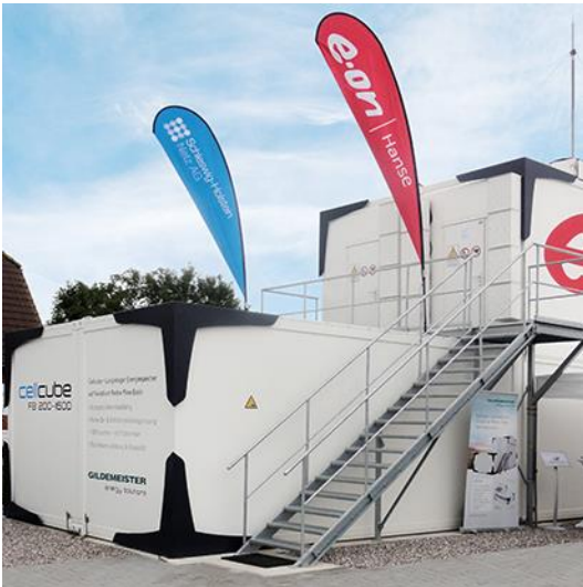
Abbildung 2: Vanadium Redox Flow Batterie von GILDEMEISTER energy solutions (links, 0.2MW/1.6MWh), (Bildquelle: Gildemeister Energy Storage GmbH)