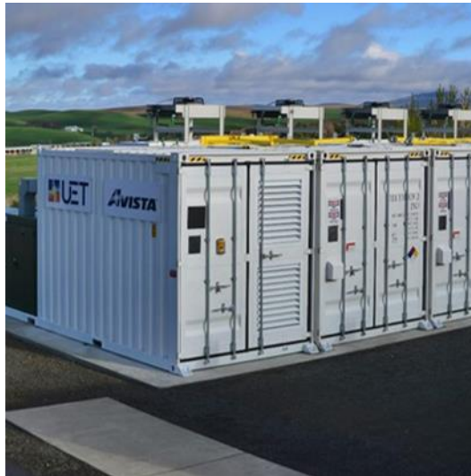
Abbildung 3: Größte Vanadium Redox Flow Batterie außerhalb Asiens (1MW/4MWh), von UniEnergy Technologies